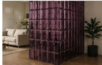
Divisiones de ambientes