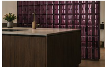
Cocina y barra