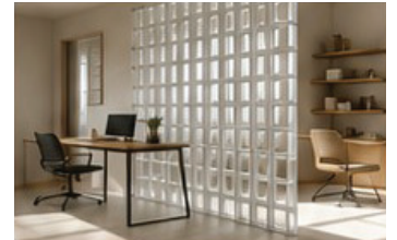
Oficina y espacios de trabajo